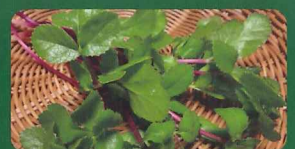
「大根島のハマボウフウ」