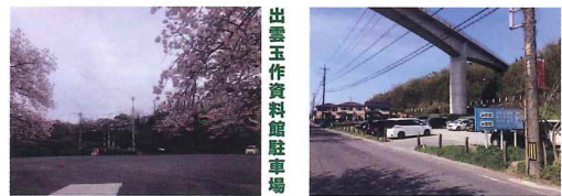
出雲玉作資料館駐車場